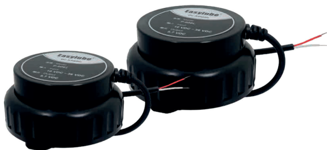
Easylube® P-606S Adaptador DC-DC para modelos 60 ml / 150 ml